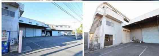
半田倉庫 -Warehouse HANDA-